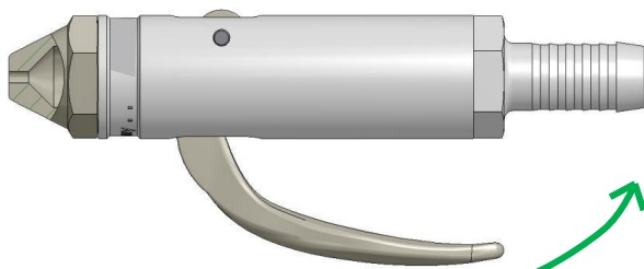
geschlossen (kein Durchfluss)